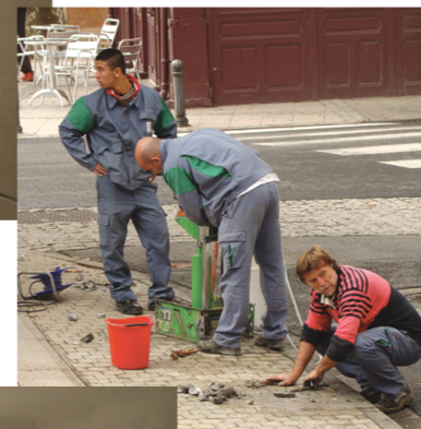
→ Remplacement des bornes anti stationnement place de l'Eglise