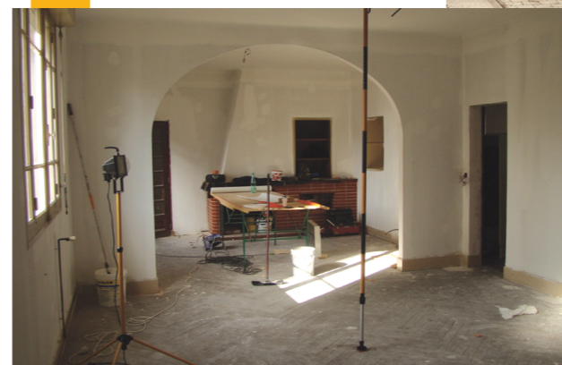
← Rénovation de la salle des mariages à la mairie