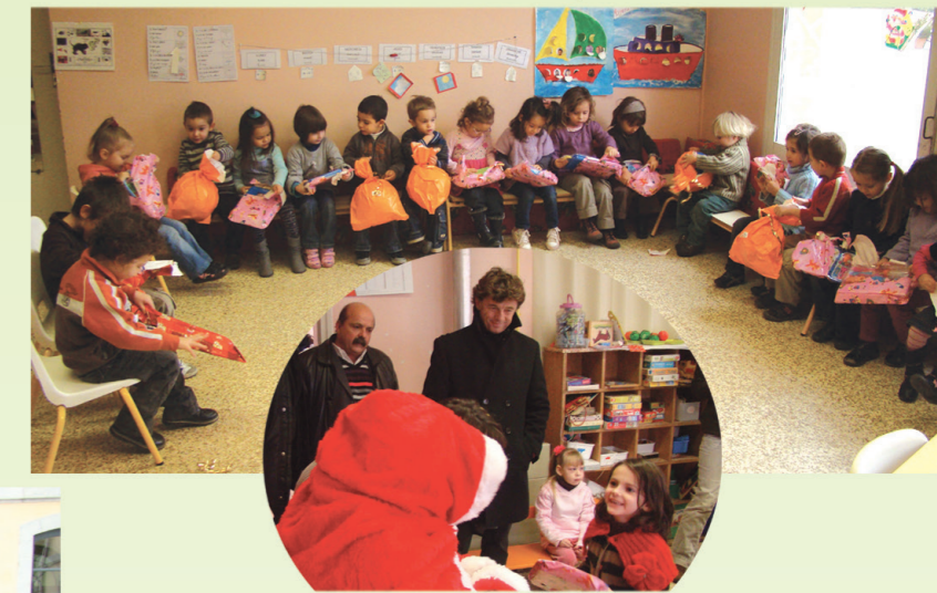
Le Noël des écoles en présence du Père Noël