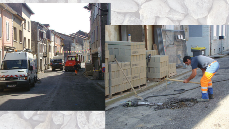
Réfections de la rue St-Barthélémy et rue Gambetta