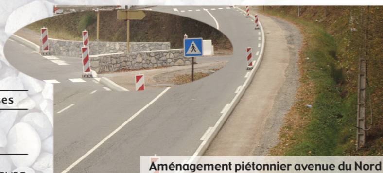
Aménagement piétonnier avenue du Nord