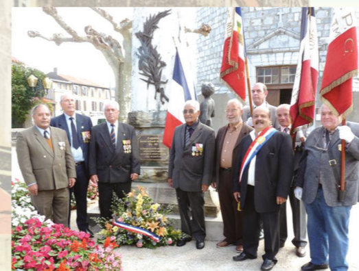
Juin : reconnaissance pour les Harkis avec une plaque posée sur le monument aux Morts