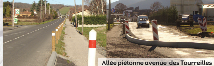
Allée piétonne avenue des Tourreilles