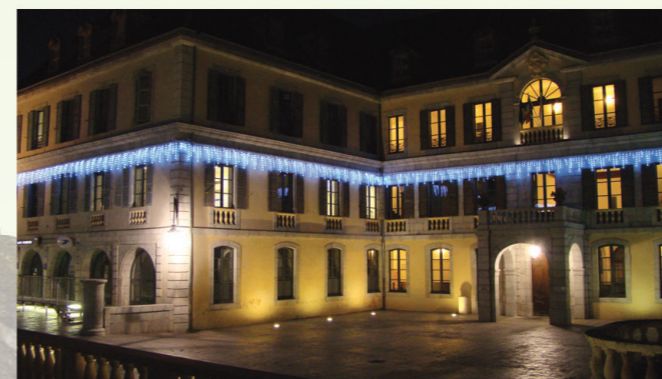
Un nouveau look pour L'Hôtel de Lassus