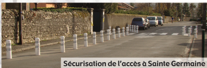
Sécurisation de l'accès à Sainte Germaine