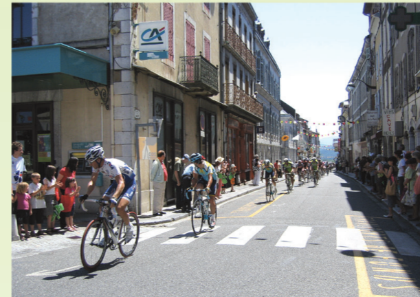
Juillet : Le Tour de France passe à Montréjeau