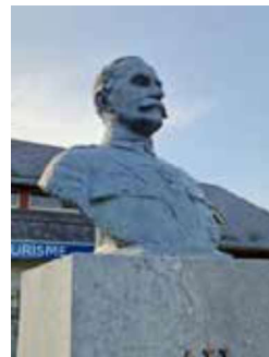
Le buste de Lourdes

Près de 11 000 euros sont nécessaires pour effectuer un moulage du buste qui se trouve à Lourdes et le coulage du nouveau buste en bronze, sculpture finie et patinée. Ce buste a les mêmes dimensions que celui qui se trouvait à Montréjeau, d'autre part, il est signé du même sculpteur : Firmin Michelet.