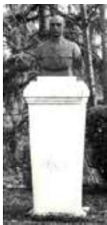
Le buste de Montréjeau

L'ADAM (Association des Amis de Montréjeau) a pour mission de promouvoir toutes initiatives et activités susceptibles d'améliorer la qualité et le cadre de vie à Montréjeau dont, plus particulièrement, celles liées au patrimoine de notre ville. A ce titre, elle lance le projet de réinstaller dans la cour d'honneur de l'Hôtel de Lassus le buste du Maréchal Foch, en faisant appel à la générosité de tous ceux, personnes, associations et organismes, intéressés par la préservation du patrimoine monréjeaulais.