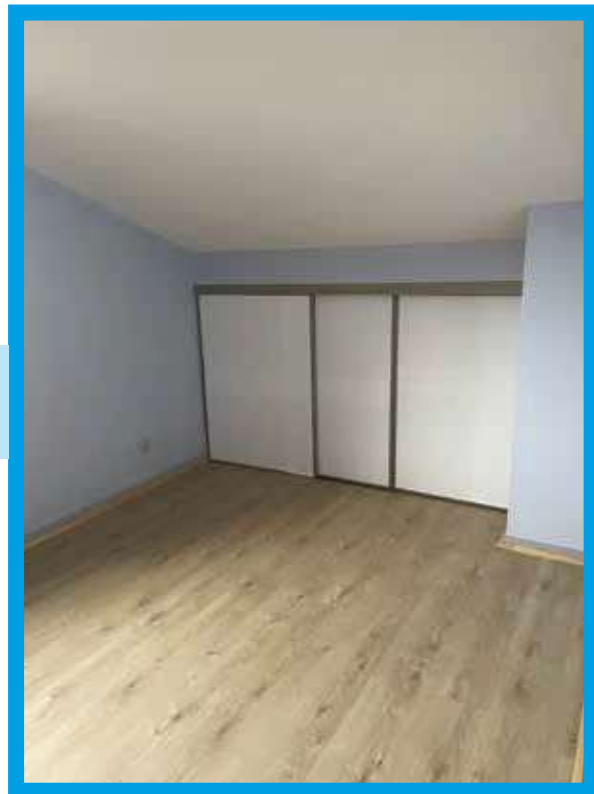
Photos de la rénovation de l'appartement de fonction de la résidence hôtelière par les services techniques municipaux.