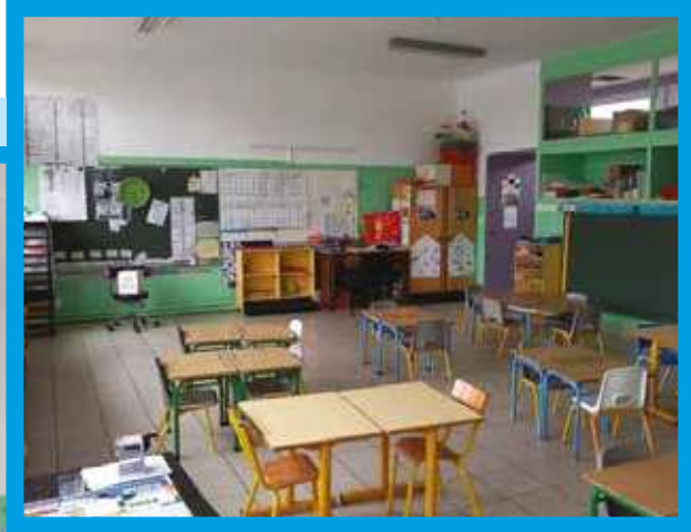
Photos de la salle de classe rénovée par les services techniques municipaux, sol, mur et plafond à la satisfaction des professeurs et pour le mieux-être des élèves.